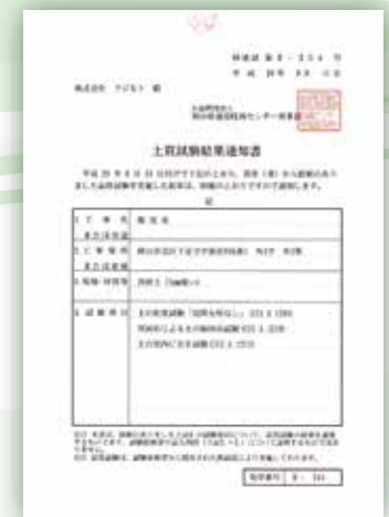
▲真砂土(5mm篩い)土質試験結果通知書