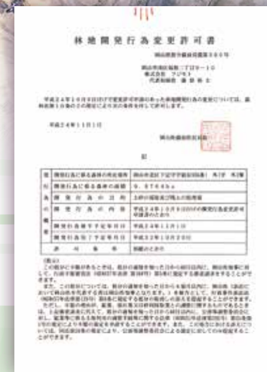
▲林地開発行為許可書

長期的、安定的に受入れが可能な県下最大規模の残土処理場を管理運営しております。また大規模な土砂搬入にも対応できる体制を取っております。建設現場から発生する残土の適正処理並びに有効利用を行い、工事の円滑な施工および地域環境の保全に努めております。