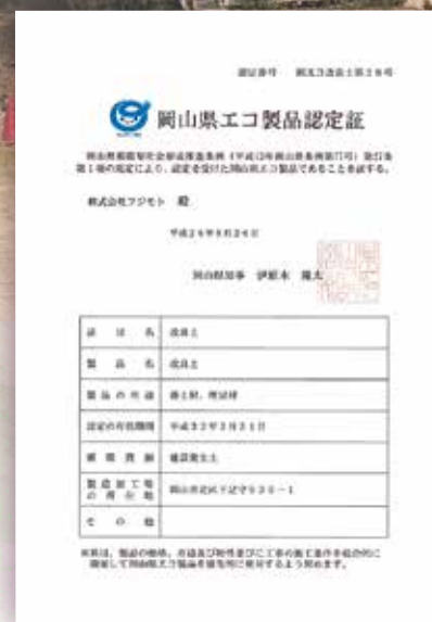
▲岡山県エコ製品認定証