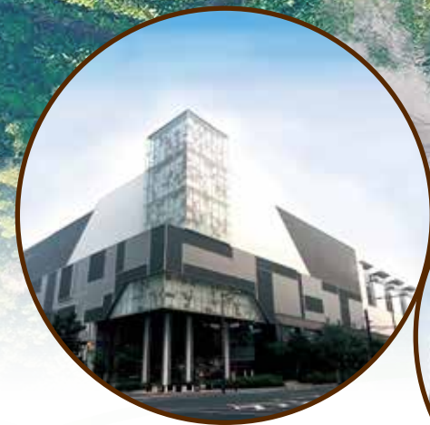
建設発生土受入事例

受け入れた建設発生土(残土)に石灰を混ぜ、粒度調整を行うことで、盛土材・埋戻し材として再利用出来る改良土にリサイクルして販売しております。