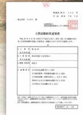
▲改良土 土質試験結果通知書