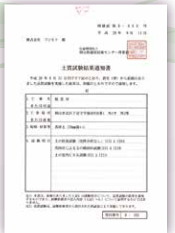
▲真砂土(30mm篩い)土質試験結果通知書